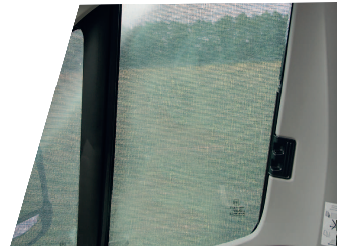
Sicht aus dem Fahrerhaus bei installierter Sommermatte

Bei Dunkelheit und Nutzung des Innenlichts, kann ein Einsehen des Innenraums nicht ausgeschlossen werden.